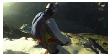
Der Russe Valery Rozov stürzte sich mit einem Hightech-Wingsuit in 4150 Metern Höhe aus der Matterhorn-Nordwand. Wingsuit-Premiere am Matterhorn