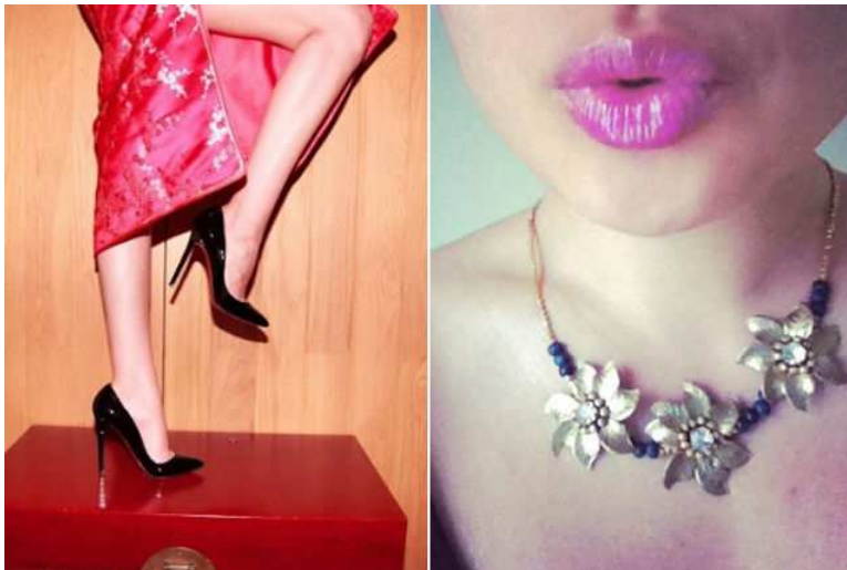
Wer wills kaufen? Von Userinnen auf Materialworld.com angebotene Secondhand-Stücke.

Secondhand-Mode – pardon, Vintage – erlebt eine Imageaufpolierung sondergleichen. Der neuste Trend heisst Re-Commerce und macht das Shoppen aus zweiter Hand zu einem neuen Erlebnis.