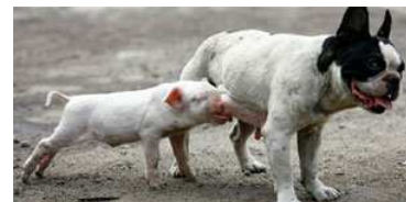
Tierische Nächstenliebe kennt keine Grenzen. Beispiele von ungleichen Paaren aus aller Welt. Wenn Schweine Hunde mögen