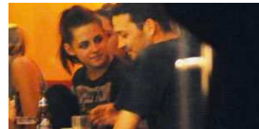
Untreue ist kein männliches Phänomen. Aber eine beim Seitensprung erwischte Frau ändert die Dramaturgie. Betrügen Frauen anders?