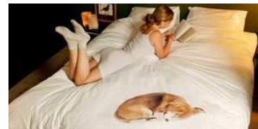
Trompe-l'oeil-Effekte bringen viel Humor in eine Wohnung. Schöne Beispiele finden Sie hier.